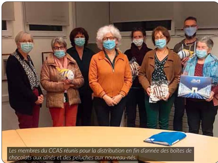
Les membres du CCAS réunis pour la distribution en fin d'année des boîtes de chocolats aux aînés et des peluches aux nouveau-nés.