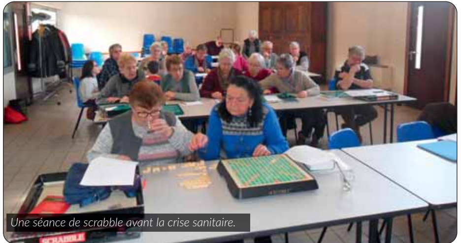
Une séance de scrabble avant la crise sanitaire.

L'Amicale des aînés espère reprendre ses activités à partir de la rentrée prochaine.