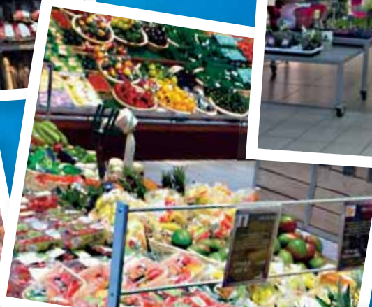
Fruits et légumes