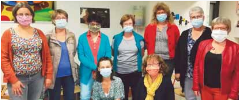
▼ Les bénévoles de la médiathèque.