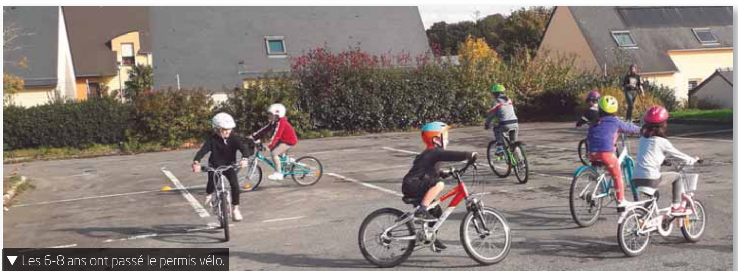
▼ Les 6-8 ans ont passé le permis vélo.