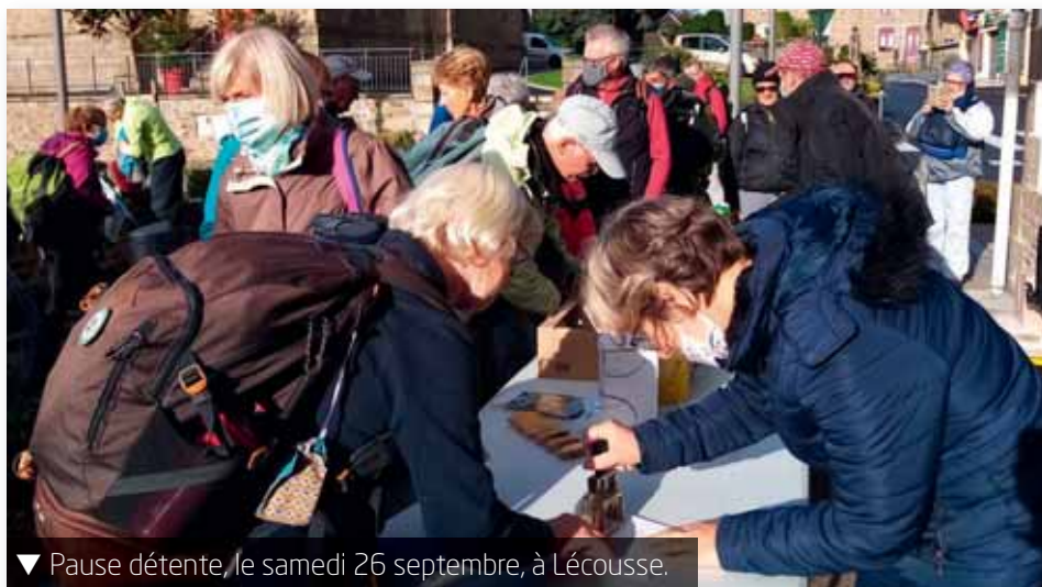
▼ Pause détente, le samedi 26 septembre, à Lécousse.

Organisée par l'association normande Les Chemins du Mont-Saint-Michel, une marche culturelle reliant Vitry au Mont s'est déroulée du 23 au 29 septembre. Pendant six jours, des marcheurs sont allés à la découverte du patrimoine et de la nature sur cet itinéraire millénaire.