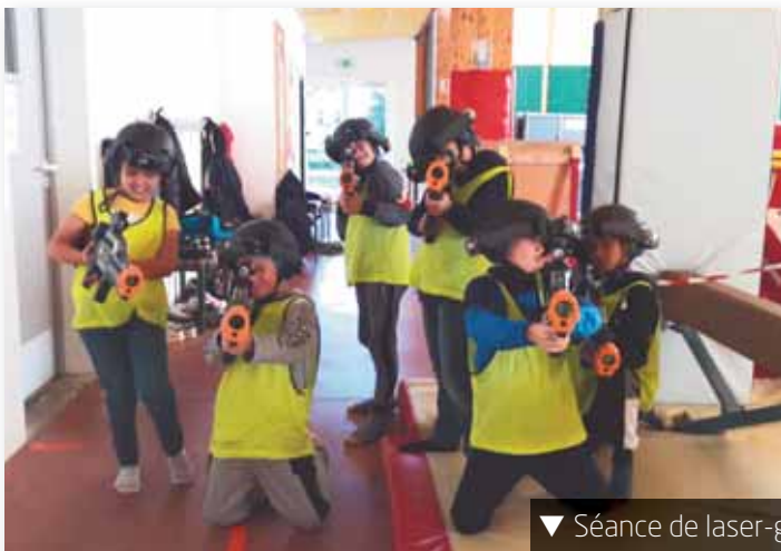
▼ Séance de laser-game pour les 9-16 ans.

Koh-Lanta, danse et poker, pas le temps de s'ennuyer ! Les jeunes se sont également rendus au cinéma de Fougères à vélo et ont participé à une séance de laser-game dans les salles communales.