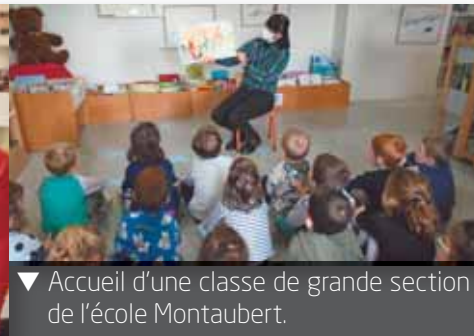
▼ Accueil d'une classe de grande section de l'école Montaubert.