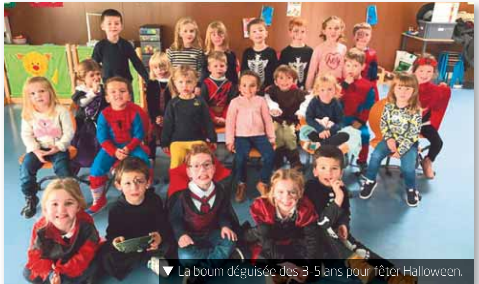
▼ La boum déguisée des 3-5 ans pour fêter Halloween.

Les 6-8 ans ont passé le permis vélo lors d'une sortie à la coulée verte, agrémentée de défis et jeux à vélo. Des sorcières les ont également initiés à leurs recettes diaboliques et ont transformé la salle de jeux