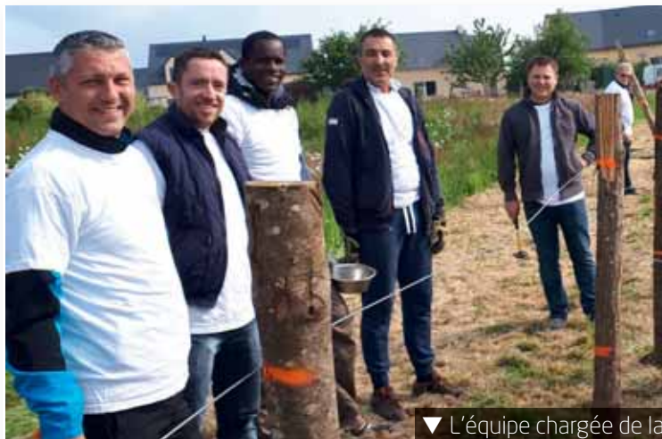
▼ L'équipe chargée de la pose d'une clôture d'éco-pâturage au bassin de la Mésangère.

La 3 ème Journée Citoyenne, organisée par la commune le samedi 18 mai en matinée, a une nouvelle fois tenu ses promesses. Au total, 140 personnes (enfants inclus) ont participé bénévolement à l'un des chantiers d'amélioration du cadre de vie. Chacun a pu travailler dans de bonnes conditions en raison d'une météo favorable : pas de pluie, du soleil et une température clémente.