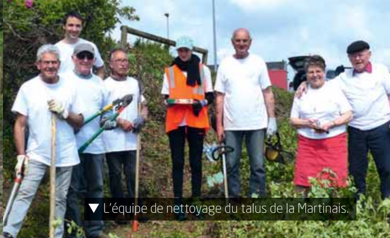
▼ L'équipe de nettoyage du talus de la Martinais.