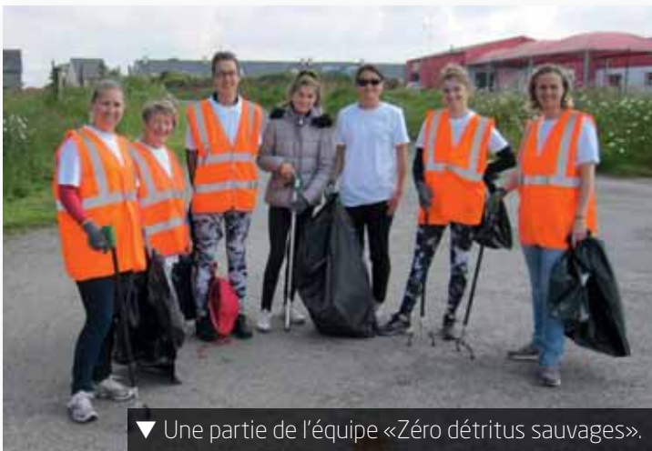
▼ Une partie de l'équipe «Zéro détritrus sauvages».