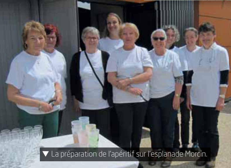
▼ La préparation de l'apéritif sur l'esplanade Morcin.