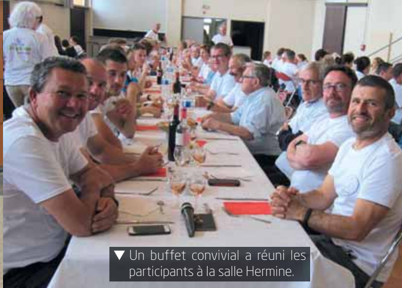
▼ Un buffet convivial a réuni les participants à la salle Hermine.