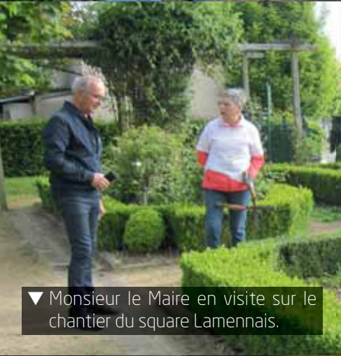
▼ Monsieur le Maire en visite sur le chantier du square Lamennais.