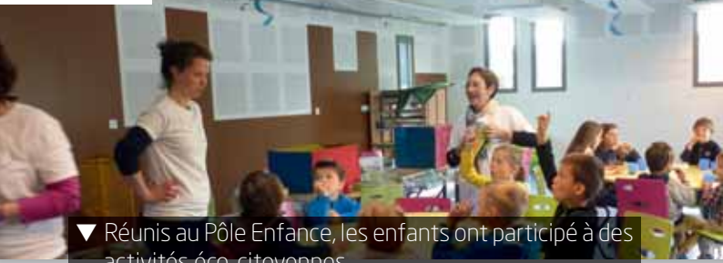
▼ Réunis au Pôle Enfance, les enfants ont participé à des activités éco-citoyennes.