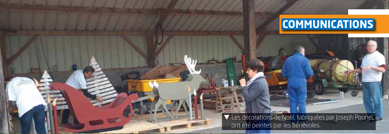
▼ Les décorations de Noël, fabriquées par Joseph Pouriel, ont été peintes par les bénévoles.