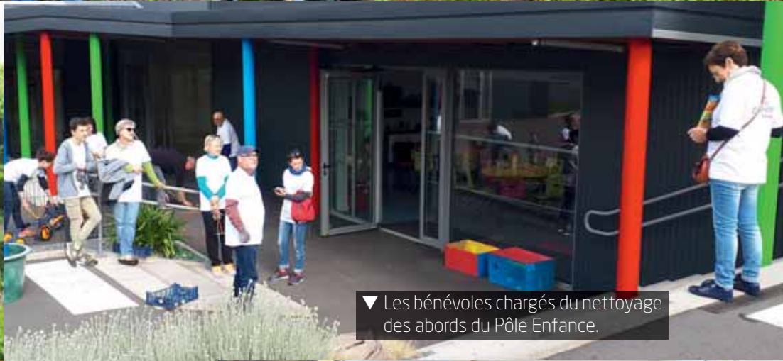
▼ Les bénévoles chargés du nettoyage des abords du Pôle Enfance.