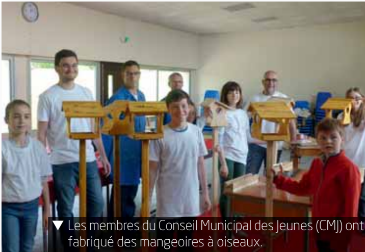
▼ Les membres du Conseil Municipal des Jeunes (CMJ) ont fabriqué des mangeoires à oiseaux.