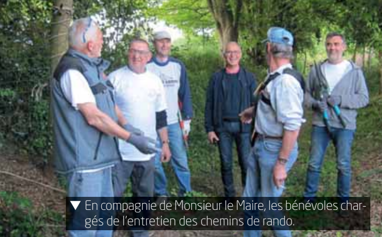
▼ En compagnie de Monsieur le Maire, les bénévoles chargés de l'entretien des chemins de rando.