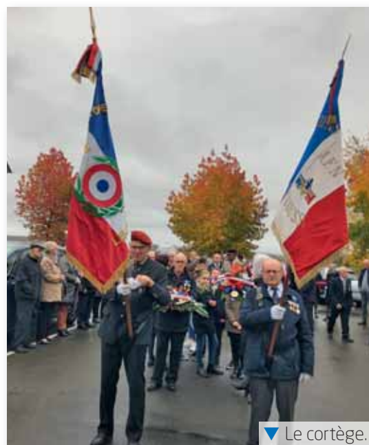
▼ Le cortège.