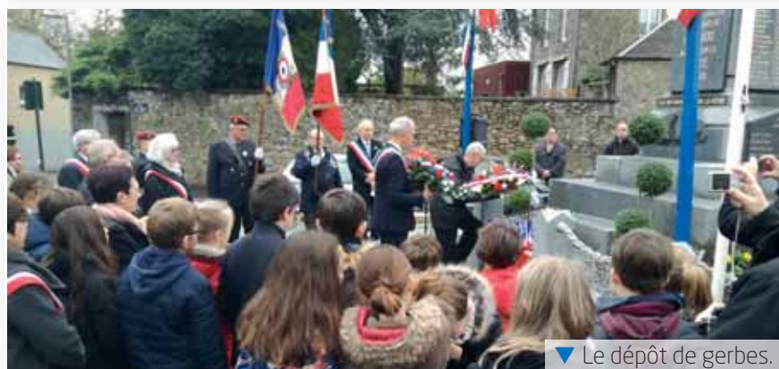
▼ Le dépôt de gerbes.