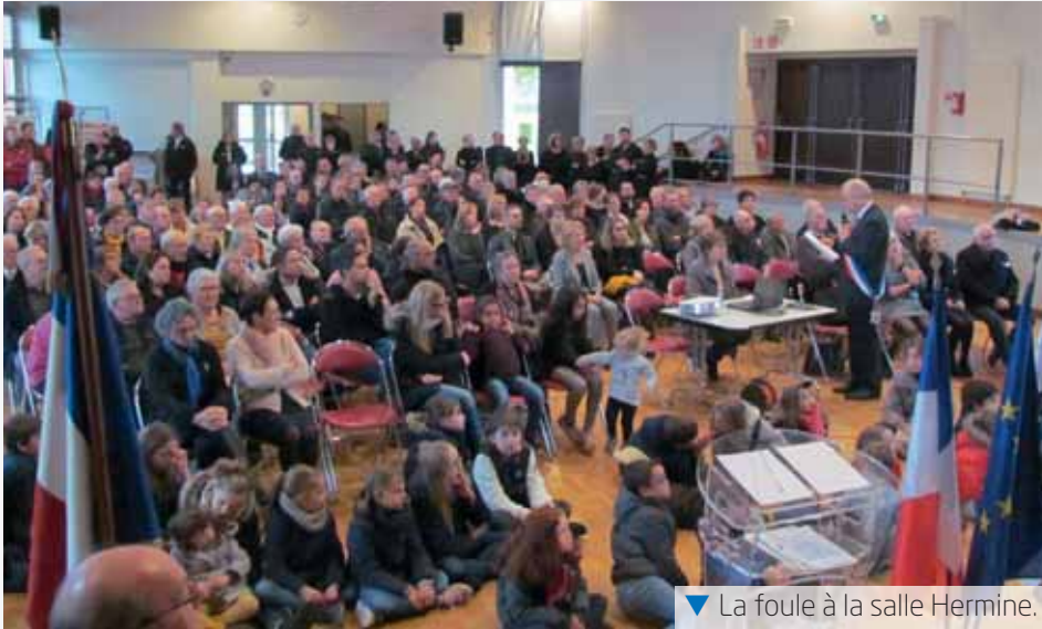
▼ La foule à la salle Hermine.

« Ainsi serons-nous dignes de la mémoire de celles et ceux qui, il y a un siècle, sont tombés. Ainsi serons-nous dignes du sacrifice de celles et ceux qui, aujourd'hui, font que nous nous tenons là, unis, en peuple libre. Vive l'Europe en paix ! Vive la République ! Et vive la France ! »