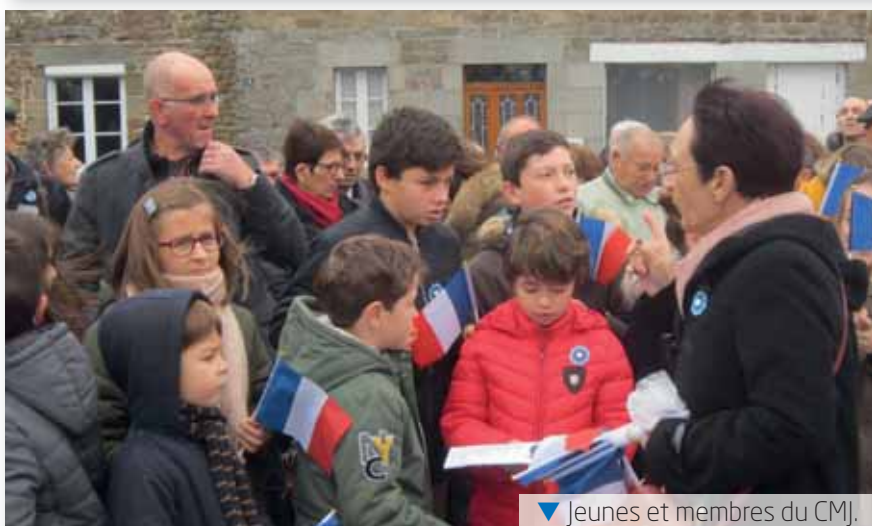
▼ Jeunes et membres du CMJ.