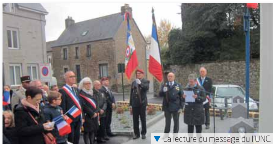
▼ La lecture du message de l'UNC.

Le 11 novembre dernier, la commune a célébré le centenaire de l'Armistice au cours d'une cérémonie digne et empreinte d'émotion. De très nombreux Lécousois, dont les membres du Conseil Municipal des Jeunes (CMJ), étaient présents pour rendre hommage aux Poilus de la commune morts pour la France il y a un siècle.