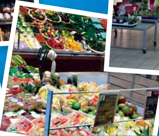
Fruits et légumes