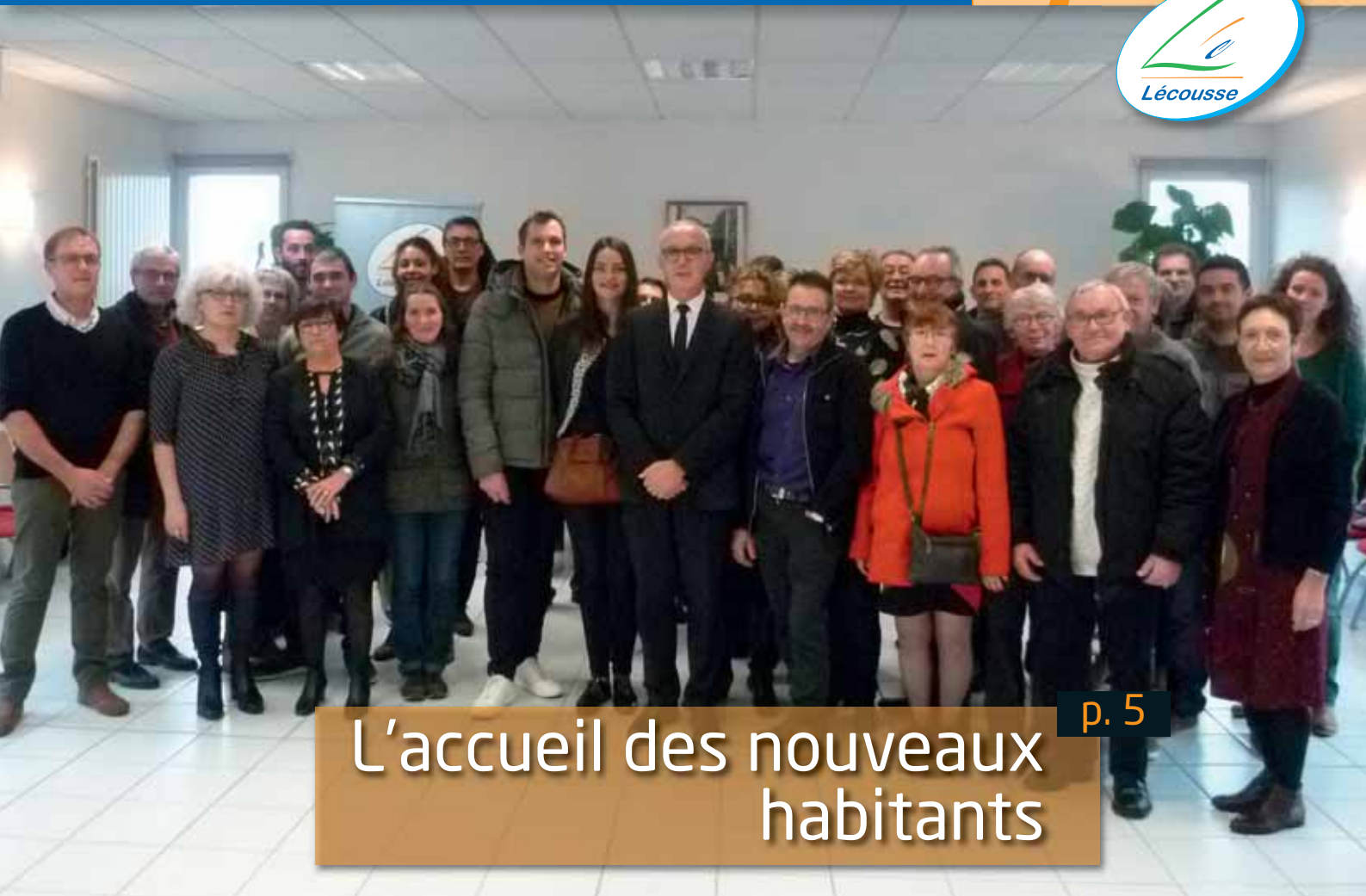
L'accueil des nouveaux habitants