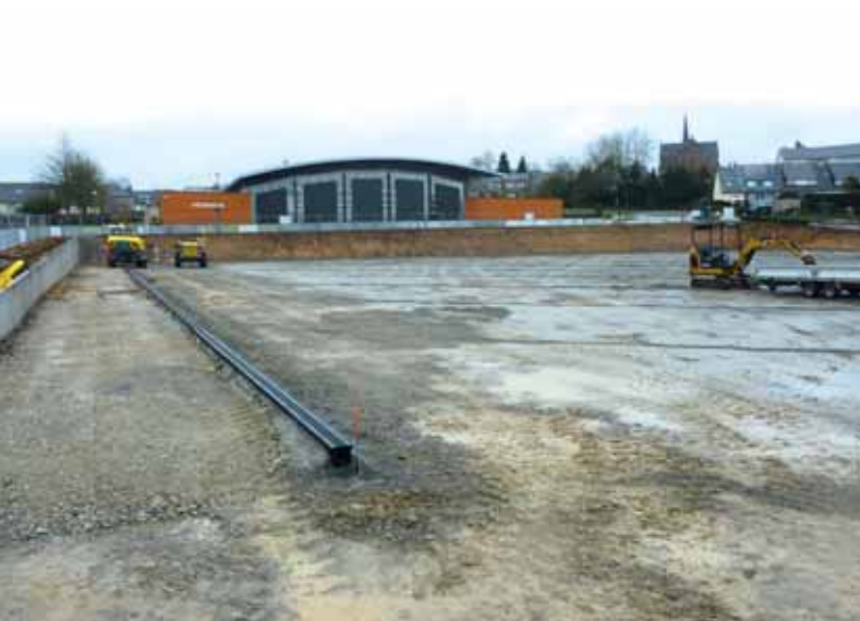
▼ Le terrain sportif synthétique est aménagé en lieu et place de l'ancien terrain stabilisé.

s'est porté sur un terrain constitué de granulats EPDM (Éthylène-Propylène-Diène Monomère). Ce matériau, qui est produit spécifiquement, répond à la norme « Jouet ». Il est utilisé notamment dans les sols souples des aires de jeux pour enfants.