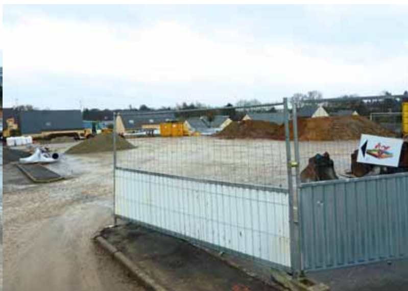
▼ Le parking sera libéré une fois les travaux terminés.