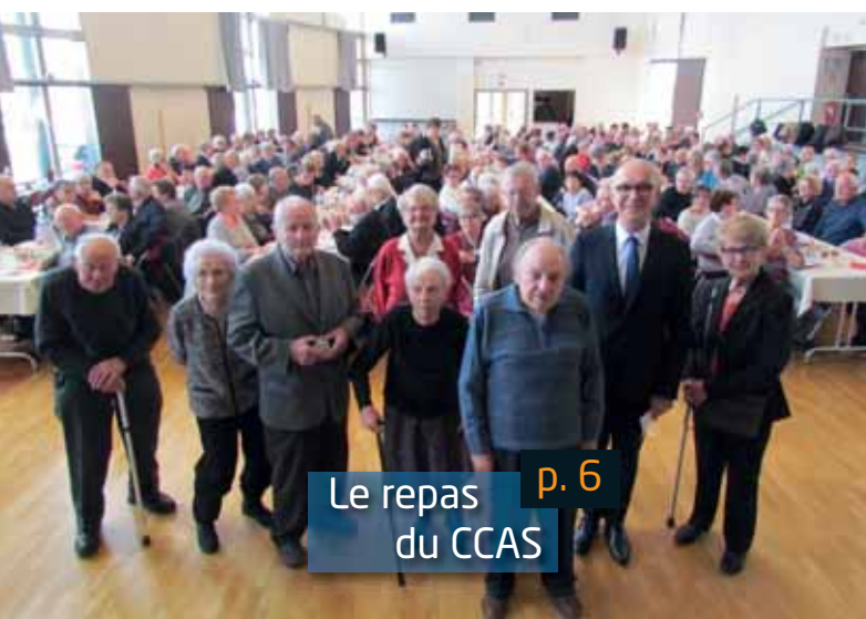
Le repas du CCAS