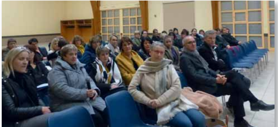
▼ Une réunion d'information sur le projet de RIPAME s'est déroulée le 5 février dernier à Romagné.

Le projet de ce nouveau service de proximité, porté administrativement par la commune de Lécousse, entame sa dernière