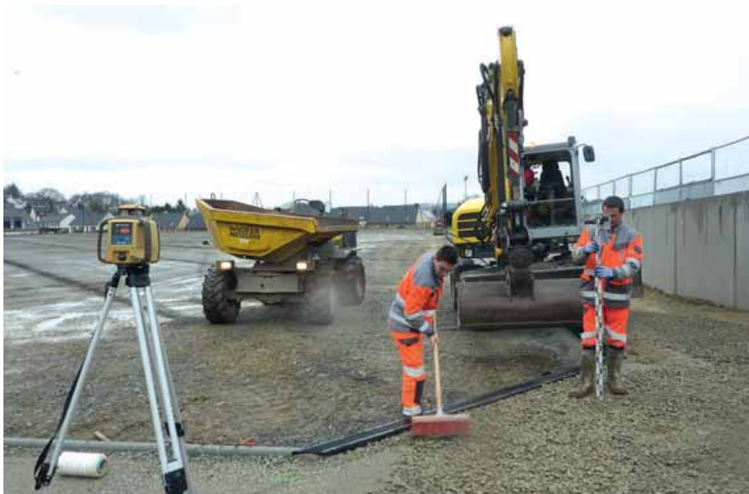
▼ Ce qui sera le dernier grand chantier du mandat va se prolonger encore quelques semaines.

Le terrain sportif synthétique, qui sera praticable par tous les temps, s'inscrit dans une démarche de préservation des ressources, et notamment de la ressource en eau puisqu'aucun arrosage n'est nécessaire pour l'entretien d'un tel terrain.