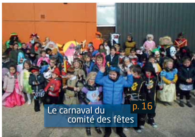
Le carnaval du comité des fêtes