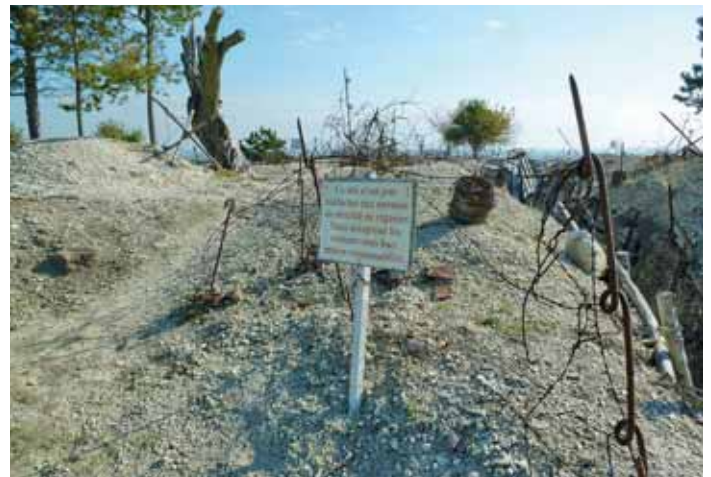
▲ La Main de Massiges, où a été tué Georges Lenoir de la Cocherie. Les tranchées sont en l'état et visitables.

Alors qu'il est étudiant à Roubaix, il est incorporé le 11 septembre 1914 au 117 e Régiment d'Infanterie en tant que soldat téléphoniste. Il est tué à l'ennemi le 23 avril 1916 à La Main de Massiges (Marne). Il est cité à l'ordre du régiment n° 174 du 18 juin