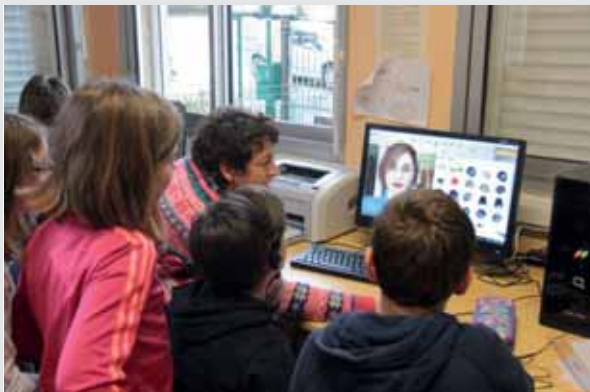
▼ Création de personnages lors d'un atelier.