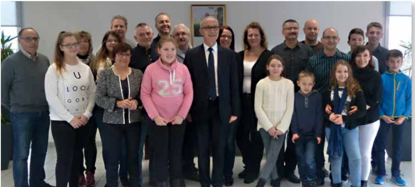
▲ La délégation de Steinsoultz a été reçue par Monsieur le Maire et des élus le samedi 13 février dernier.