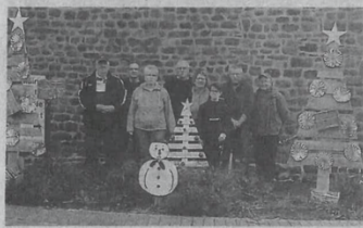
Comme chaque année, une équipe de bénévoles se donne rendez-vous pour décorer le borny de Vendée. Samedi, grâce à des matériaux de récupération, principalement du bois, la commune s'est mise l'heure de Noël.